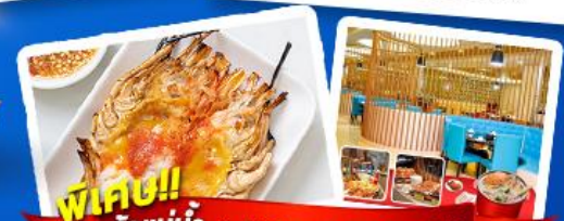
พิเศษ!! ก๊องแม่น้ำ + HOTPOT SEAFOOD