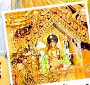
พระสุริยันจันทร