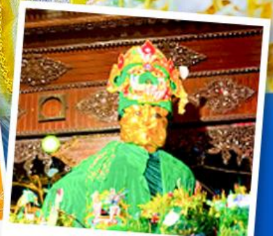
ขอพรมแม่ยักษ์