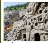
ถ้ำหินหลงเหมิน