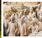
พิพิธภัณฑ์กองทัพใต้ดิน