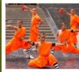
โซ่วเล่าหลิน

กำแพงเมืองโบราณซีอาน / วัดลามะ / ตลาดมุสลิม ป่าเจดีย์ / โชว์การแสดงวิทยายุทธเส้าหลิน / โชว์ราชวงศ์ถัง อุทยานหยุนไถซาน / ศาลเจ้ากวนอู / ถ้ำหินหลงเหมิน / วัดเส้าหลิน พิพิธภัณฑ์กองทัพใต้ดินทหารม้าจีน / ถนนคนเดินวัฒนธรรมต้าถิง