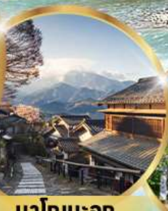
มาโกเมะจุกุ