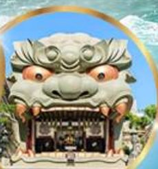
ศาลเจ้านิมะ ยาชากะ