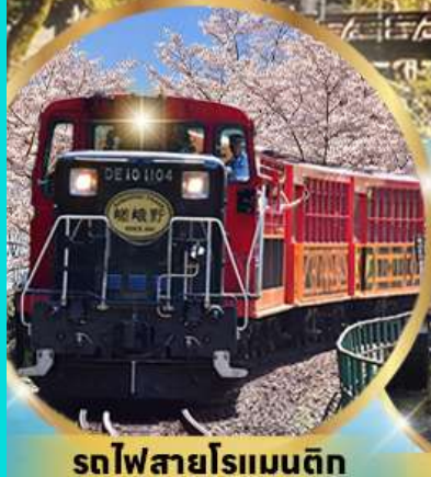
รถไฟสายโรแมนติก