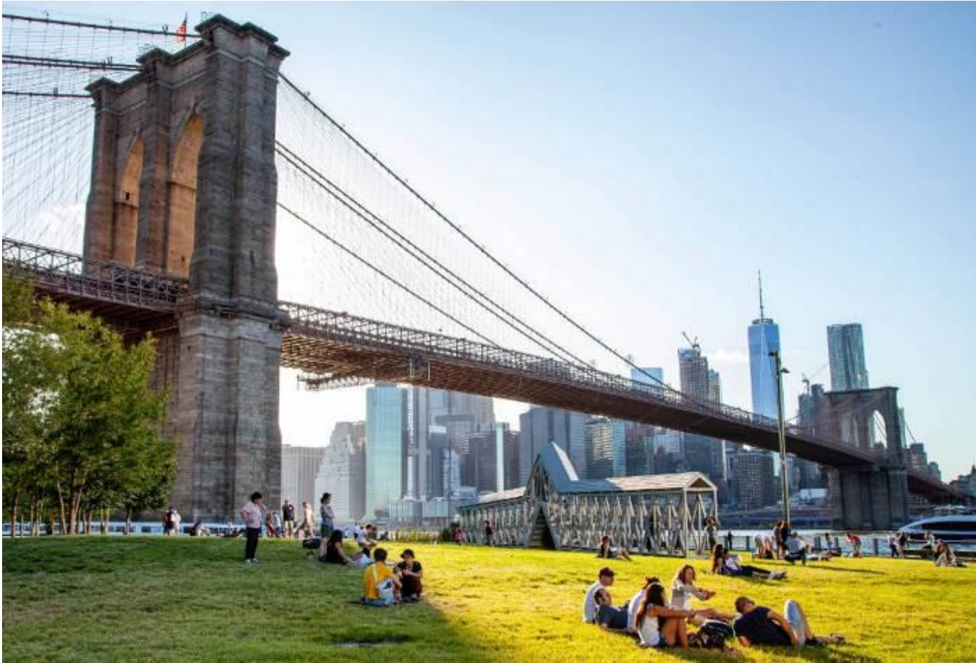
กลางวัน รับประทานอาหารกลางวัน ณ ภัตตาคารท้องถิ่น

นำท่านเดินทางชมสวนสาธารณะสะพานบรูคลิน (Brooklyn Bridge Park) เป็นสวนสาธารณะขนาด 85 เอเคอร์ บนฝั่งบรูคลินของแม่น้ำอีสต์ในนิวยอร์กซิตี สวนสาธารณะแห่งนี้ได้รับการออกแบบโดยบริษัทภูมิสถาปัตย์กรรม Michael Van Valkenburgh Associates บนพื้นที่ 2.1 กม. จากแอตแลนติกอเวนิวทางใต้ ใต้บรูคลินไฮท์สพยอมเมอนาค และผ่านสะพานบรูคลิน ไปจนถึงถนนเจย์ทางตอนเหนือของ สะพานแมนฮัตตัน. จากเหนือจรดใต้ อุทยานแห่งนี้ประกอบด้วยท่าเรือเฟอร์รี่ Empire–Fulton Ferry และสวนสาธารณะ Main Street ที่มีอยู่แล้ว ท่าเรือเฟอร์รี่ Fulton อันเก่าแก่; และท่าเรือ 1–6 ซึ่งมีสนามเด็กเล่นและการพัฒนาที่อยู่อาศัยต่างๆ สวนสาธารณะแห่งนี้ยังมีร้าน Empire Stores และ Tobacco Warehouse ซึ่งเป็นอาคารสองแห่งสมัยศตวรรษที่ 19 และเป็นส่วนหนึ่งของ Brooklyn Waterfront Greenway ซึ่งเป็นสวนสาธารณะและเส้นทางจักรยานหลายแห่งรอบๆ บรูคลิน จากนั้นนำท่านถ่ายรูปกับสะพานบรูคลิน (Brooklyn Bridge) สร้างเสร็จเมื่อปี ค.ศ. 1883 เคยเป็นสะพานแขวนที่ใหญ่ที่สุดในโลก และเป็นสะพานแขวนที่เก่าแก่ที่สุดในสหรัฐอเมริกา มีความยาว 1825 เมตร ทอดข้ามแม่น้ำอีสต์ เชื่อมระหว่างนิวยอร์กซิตี แมนฮัตตัน และบรูคลิน