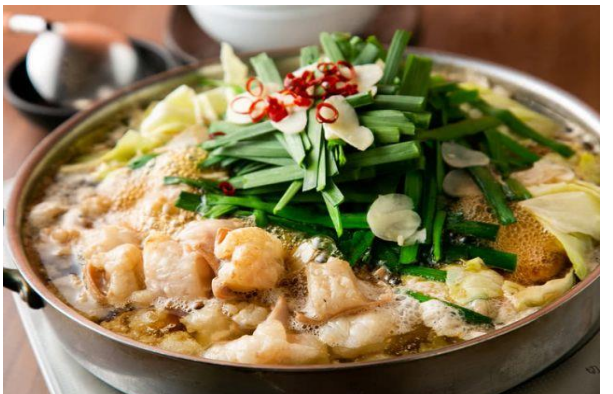
ร้านอาหารย่านยะไต (YATAI)

เย็น อิสระรับประทานอาหารค่ำตามอัธยาศัย เพื่อให้ท่านได้ช้อปปิ้งอย่างเต็มที่ (มีไกด์แนะนำ) ➡ พักค้างคืน ณ โรงแรม Nishitetsu Inn Hotel (★★★★) หรือเทียบเท่า ใจกลางย่านเทนจิน