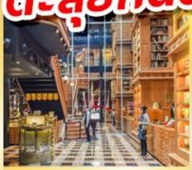
ร้านไอศกรีมมียาฮาร่า