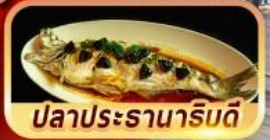
ปลาประรานาโรบิต