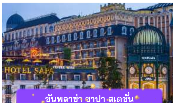
ชั้นพลาซ่า ซาปา สเตชั่น