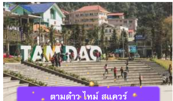
ตามด้าว ไทม์ สแควร์

เช็คอิน ตามด้าว ไทม์ สแควร์ ที่นี่เป็นพลาซ่าสาธารณะกลางเมือง เป็นพื้นที่ที่ชาวตามด้าวใช้พักผ่อนกันเป็นลานน้ำพุกว้าง ๆ ที่มองเห็นเมืองโดยรอบ ซึ่งรอบๆจัตุรัสนี้ก็จะมีร้านค้า คาเฟ่ ร้านอาหาร และมีมุมถ่ายรูปน่ารักๆ เหมาะสำหรับการถ่ายรูป นำท่านเดินทางกลับ เมืองฮานอย