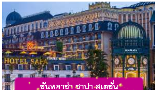
ชั้นพลาซ่า ซาปา สเตชั่น