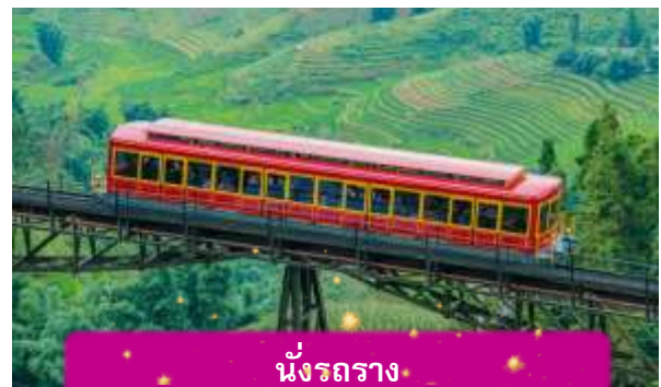
นั่งรถราง

เที่ยง บริการอาหารกลางวัน ณ ภัตตาคาร พิเศษ ... เมนูบุฟเฟ่ฟานซีปัน