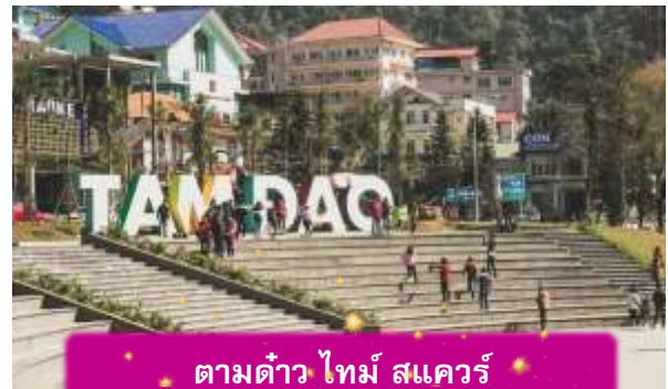
ตามด้าว ไทม์ สแควร์

อิสระท่าน ตลาดกลางคืนตามด้าว เมื่อแสงแดดลับขอบเขา เมืองบนดอยแห่งนี้จะค่อย ๆ เปลี่ยนบรรยากาศเป็นความคึกคักแบบเรียบง่าย ตลาดกลางคืนตามด้าวเต็มไปด้วยของกินพื้นเมือง กลิ่นหอมของหมูย่าง ไชนักระหทา และข้าวโพดย่างลอยคลุ้งไปทั่ว นักท่องเที่ยวเดินจับจ่าย พุดคุย และหยุดถ่ายรูปตามแสงไฟที่ประดับอยู่ทั่วตลาด บรรยากาศเป็นกันเองและอบอุ่น เหมาะกับการเดินเล่น ปิดท้ายวันด้วยความสุขเล็ก ๆ ที่สัมผัสได้