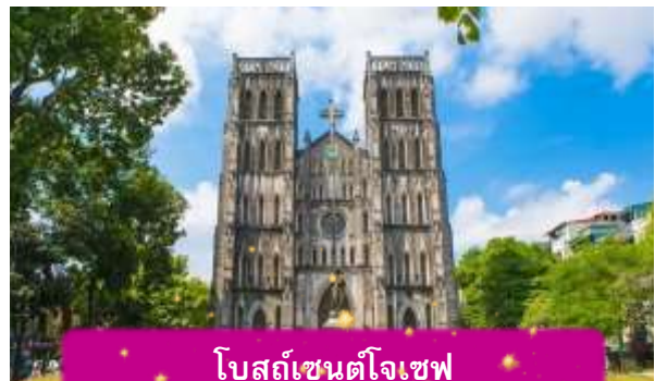
โบสถ์เซนต์โจเซฟ