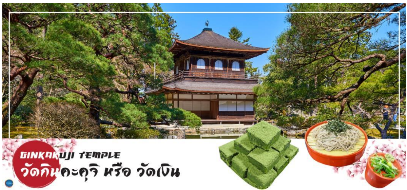
GINKAKUJI TEMPLE วัดกินคะคุจิ หรือ วัดเงิน