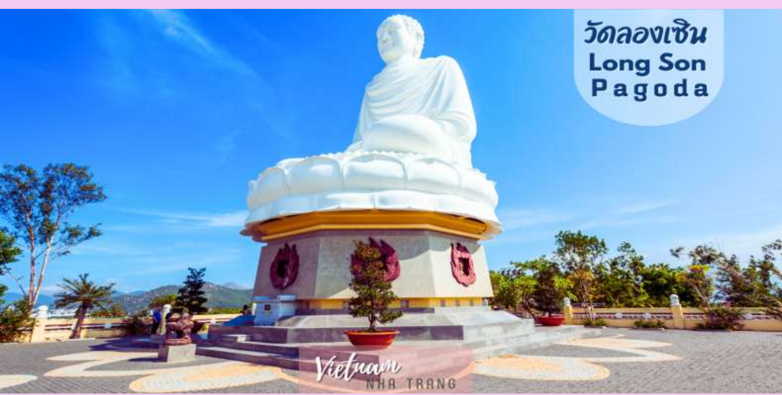
วัดลองเซิน Long Son Pagoda