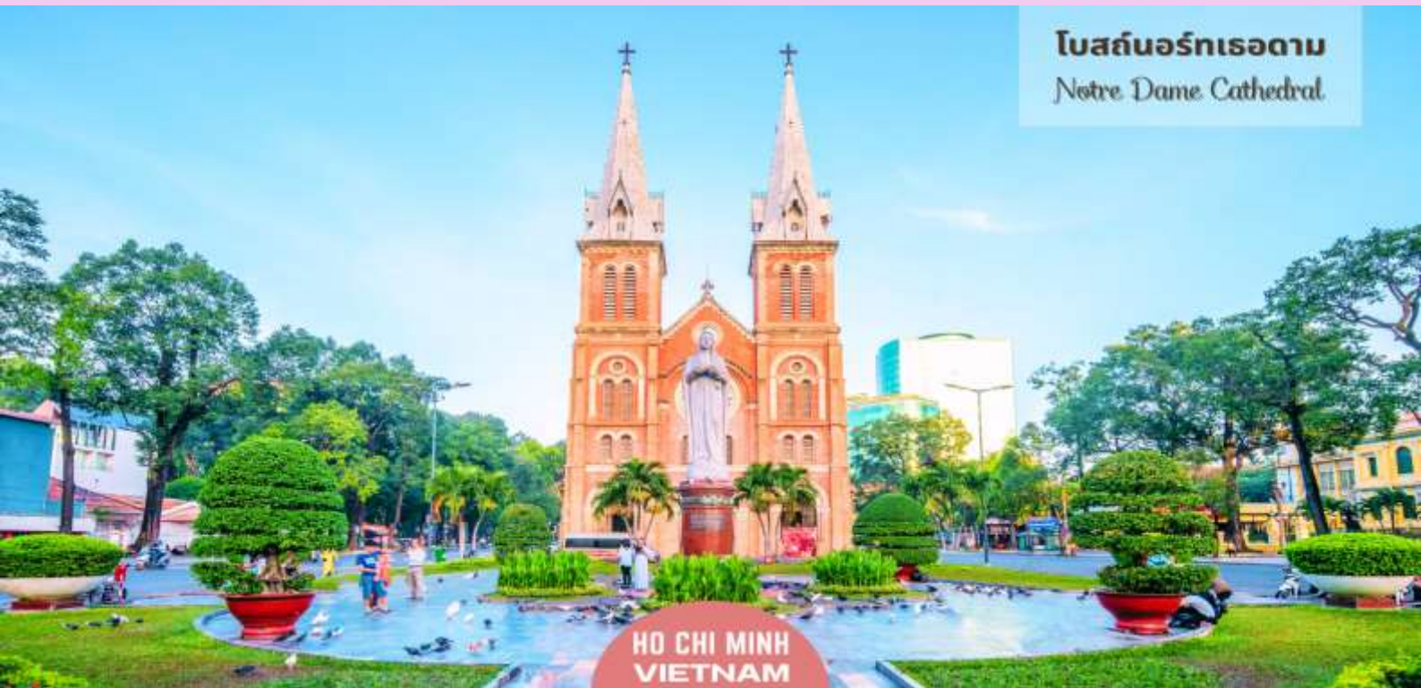
โบสถ์นอร์ทเธอดาม Notre Dame Cathedral

นำท่านถ่ายรูป มหาวิหารนอร์ทเทรอดาม เป็นอัญมณีทางสถาปัตยกรรมอันงดงามที่มีความสำคัญทางประวัติศาสตร์และวัฒนธรรม วิหารแห่งนี้สร้างขึ้นในยุคอาณานิคมฝรั่งเศส และเป็นสัญลักษณ์ของมรดกอันมั่งคั่งและความศรัทธาอันยาวนานของชาวเมืองไซงอน วัสดุที่ใช้ก่อสร้างล้วนนำเข้ามาจากฝรั่งเศส เป็นการผสมผสานอิทธิพลระหว่างยุโรปและเวียดนามอย่างลงตัว ความสมบูรณ์ของโครงสร้างเป็นข้อพิสูจน์ถึงคุณภาพของวัสดุเหล่านี้ รวมถึงอิฐสีแดงที่แข็งแรงในส่วนหน้าของอาคารซึ่งมีความวิจิตรสวยงาม และยอดแหลมที่สูงตระหง่าน ภายในวิหารยังได้รับการออกแบบให้รองรับผู้คนได้ประมาณ 1,200 คน