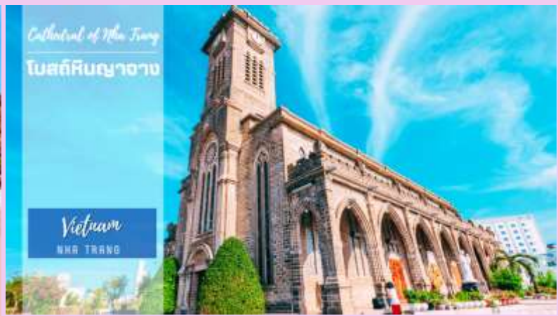
Cathedral of the Holy Trinity โบสถ์คริสต์นอร์ท Vietnam NHA TRANG