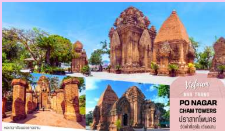
Vietnam NHA TRANG PO NAGAR CHAM TOWERS ปราสาทโพนคร วัดที่ลือเลื่อง เมืองนบ

นำท่านเดินทางไปยัง ปราสาทโพนคร เป็นปราสาทที่เก่าแก่ในสมัยคริสต์ศตวรรษที่2 สมัยอาณาจักรจามปา มีความเก่าแก่และโดดเด่น ลักษณะของปราสาทเป็นอิฐแดงขนาดใหญ่ ถูกสร้างขึ้นเพื่อประดิษฐานเทพสตรีภควดี ในอดีตเคยเป็นที่บูชาเทพเจ้าในศาสนาฮินดู และเป็นที่พักกระแทยเจ้าของชาวเวียดนามในปัจจุบัน จากนั้นนำท่านชม โบสถ์หินนาตรัง เป็นโบสถ์ที่ใหญ่ที่สุดในเมืองญาจาง ตั้งโดดเด่นอยู่บนเนินสูง 10 เมตร ห่างจากทะเลเพียงแค่ 1กิโลเมตร โบสถ์หลังนี้ถูกสร้างขึ้นในสไตล์ฝรั่งเศสโกธิคโดยนักบุญหลุยส์วอลเล็ท ภายในโบสถ์ถูกตกแต่งด้วยกระจกสี มีสีอันสวยงาม ด้านในสามารถจุคนได้ถึง 600 คน ตัวโบสถ์ถูกสร้างด้วยบล็อกซีเมนต์ และใช้หินในการปูพื้น