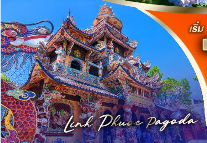
Linh Phuoc Pagoda