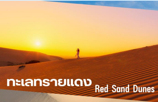
ทะเลทรายแดง Red Sand Dunes

นำท่านชมความงดงามของ ทะเลทรายแดง (Red Sand Dunes) สถานที่ท่องเที่ยวที่มีชื่อเสียงมากและอยู่ใกล้ชายทะเลเม็ดทรายละเอียดสีแดงละเอียดราวกับแป้ง เนินทรายจะเปลี่ยนรูปร่างไปตามแรงลมที่พัดผ่านมา จากนั้นชมและสัมผัสความยิ่งใหญ่เม็ดทรายละเอียดสีขาวของ ทะเลทรายขาว (White Sand Dunes) หรือที่เรียกว่าทะเลทรายขาวทะเลทรายที่ใหญ่ที่สุดของเวียดนามหรือ ซาฮาร่าแห่งเวียดนาม ( แถมฟรีคาร์ตจี๊ปเที่ยวชมทะเลทราย )