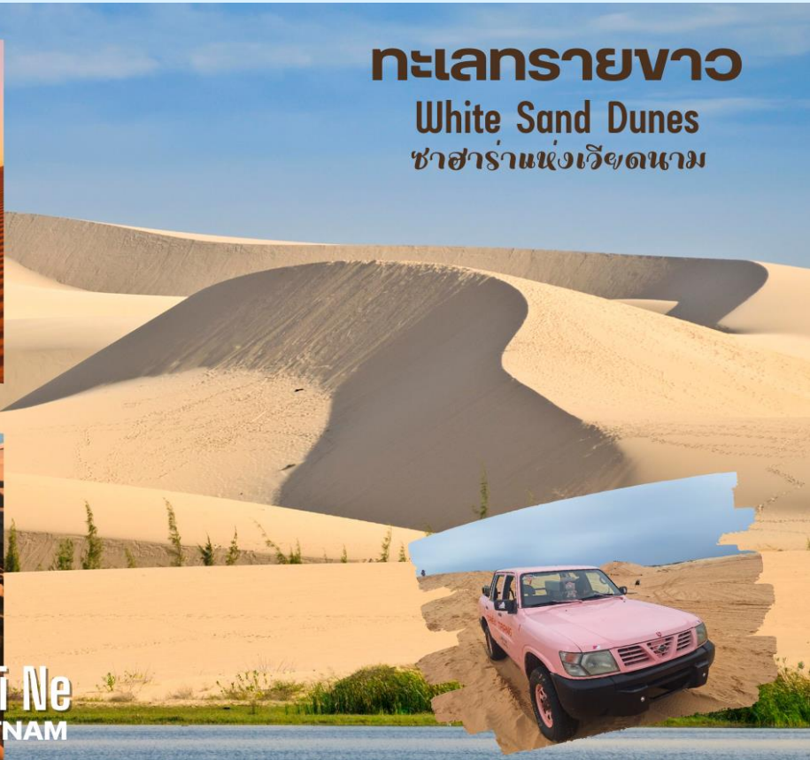
ทะเลทรายขาว White Sand Dunes ซาฮาร่าแห่งเวียดนาม