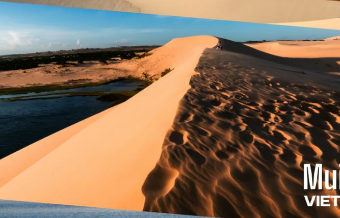
Mui Ne VIETNAM