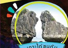
เกาะโก๋ซงกัน