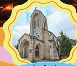
โบสถ์ซาปา