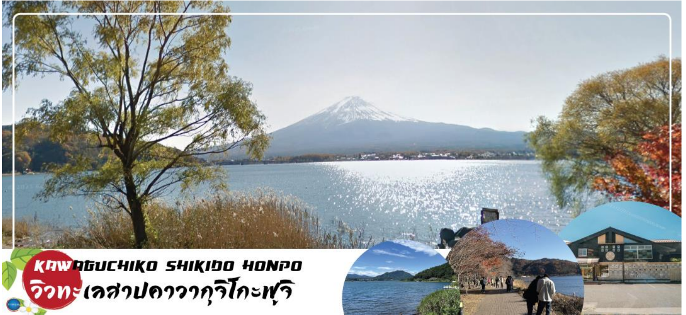
KAWAGUCHIKO SHIKIBO HONPO วิหะเลสาบคาวากูจิโกะฟูจิ

เมืองยามานาชิ – พิธีชงชาญี่ปุ่น – จุดชมวิวยะลีสาบคาวากูจิโกะ – กรุงโตเกียว – ชมแมวยักษ์ 3 มิติ พร้อมช้อปปิ้ง ย่านชินจูกุ – ย่านโอไดบะ – ห้างไดเวอร์ซิตี – เมืองนาริตะ