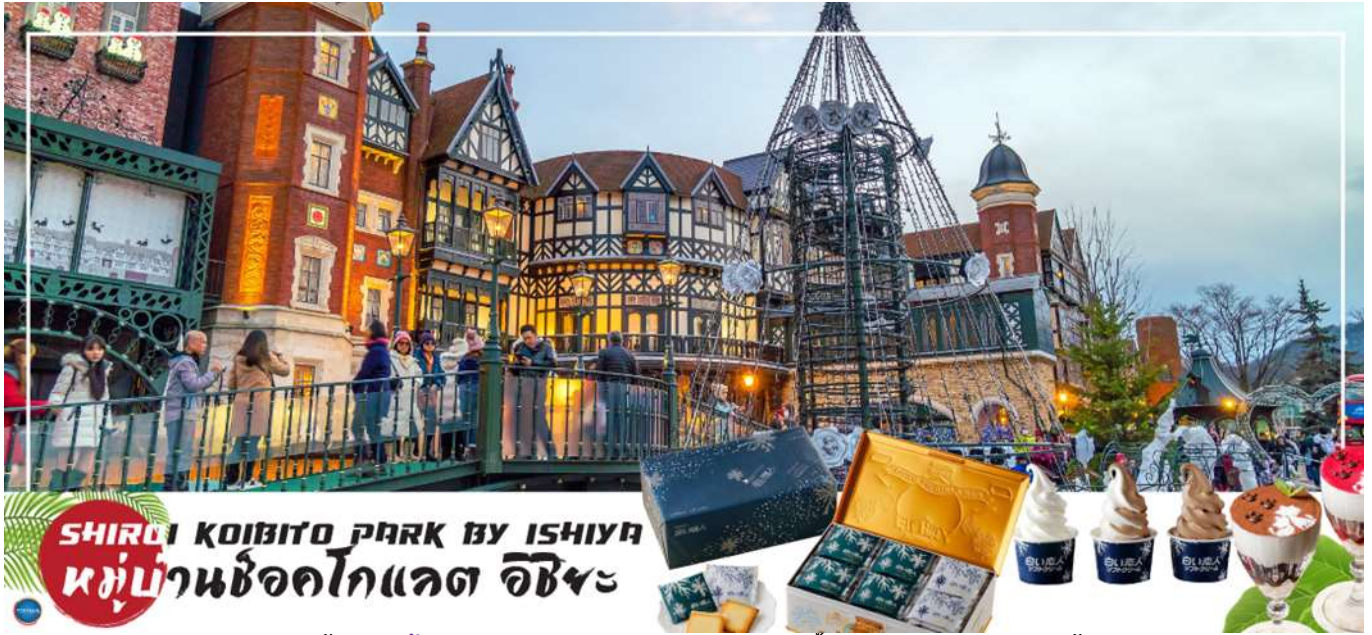
SHIROI KOIBITO PARK BY ISHIYA หมู่บ้านช็อคโกแลต อิชิยะ

จากนั้นนำท่านสู่ หมู่บ้านช็อคโกแลต อิชิยะ (Shiroi Koibito Park by Ishiya) (ใช้เวลาเดินทางประมาณ 30 นาที) แหล่งผลิตช็อคโกแลตที่มีชื่อเสียงของญี่ปุ่น ตัวอาคารของ โรงงานถูกสร้างขึ้นในสไตล์ยุโรป แวดล้อมไปด้วยสวนดอกไม้ จึงทำให้บรรยากาศของหมู่บ้านช็อคโกแลตที่นี่ดูคลาสสิกและน่ารักไปอีกแบบ ช็อคโกแลตที่ขึ้นชื่อที่สุดของที่นี่คือ Shiroi Koibito ซึ่งมีความหมายว่าช็อคโกแลตขาวแต่คนรัก ท่านสามารถเลือกช็อคโกกลับไปให้คนที่ท่านรักทานหรือว่าซื้อเป็นของฝากติดไม้ติดมือกลับบ้านก็ได้ นอกจากนี้ท่านจะได้เลือกซื้อช็อคโกแลตที่หาซื้อที่ไหนไม่ได้ และ ท่านก็ยังจะได้ชมประวัติความเป็นมาของโรงงาน และการผลิตช็อคโกแลตอีกด้วย