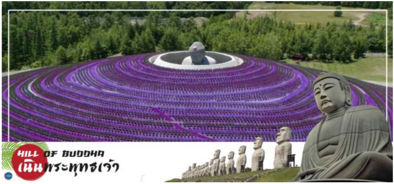
HILL OF BUDDHA เนินพระพุทธรเจ้า

วันที่เจ็ด ตลาดปลานิวโจ – เนินพระพุทธรเจ้า – มิดซุยเอาเลัตท์ – ท่าอากาศยานนิวซีโดสะะ ฮอกไกโด – ท่าอากาศยานนานาชาติคันไซ โอซาก้า