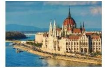
พาลาเมนต์

** พักที่ AT EVENT PYRAMIDE 4* HOTEL หรือเทียบเท่า **