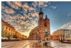
เมืองเก่า คราคอฟ