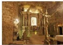
เหมืองเกสึอวิลลิกซ์กา

** พักที่ OREA VORONE 4* HOTEL หรือเทียบเท่า **