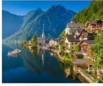
ฮอลล์สตัท Hallstatt