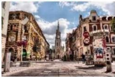
ย่านเมืองเก่า คาโตวีเซ Kotowice