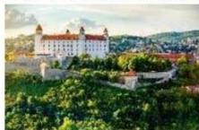
ปราสาทบราติสลา