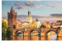
สะพานชาร์ลส์

** พักที่ CLARION CONGRESS 4* HOTEL หรือเทียบเท่า **