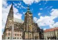
กรุงปราก Prague