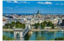
กรุงบูดาเปสต์