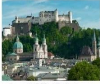
ซาลสเบิร์ก Salzburg

** พักที่ AT WEST 4* HOTEL หรือเทียบเท่า **