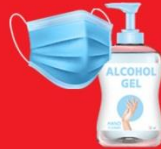
แจกแมส, เจล