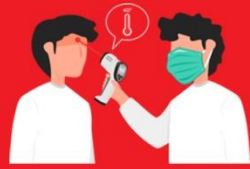
วัดไข้ผู้เดินทาง