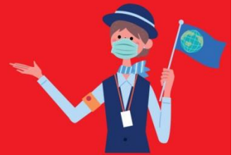
ไกด์ใส่แมสตลอดเวลา