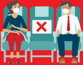
สายการบิน