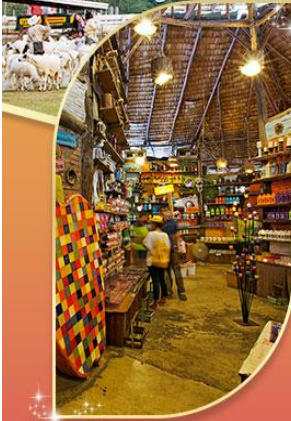
บ้านหอมเทียน