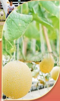
คลอโรฟว้า