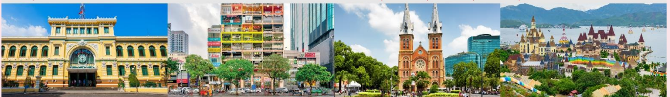
ไพรม์ชณีย์กลางโฮจิมินห์