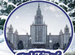
สแปร์โรฮิลล์