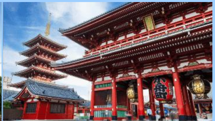
SENSOJI TEMPLE NAKAMISE STREET