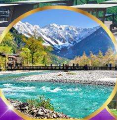
คามิโคจิ