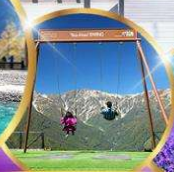
ชิงช้า Yoo hoo! Swing