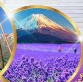
โออิชิ ปาร์ค