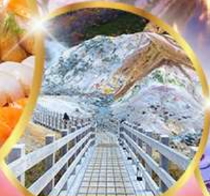
หุบเขานรกจิทอกุตามิ