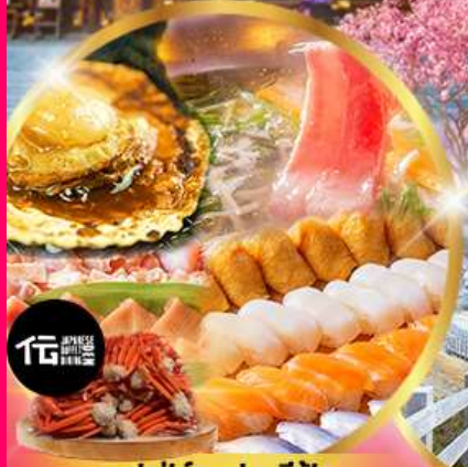
บุฟเฟ่ต์ซาปู + ซัฟัด อาหาร มากกว่า 50 เมนู