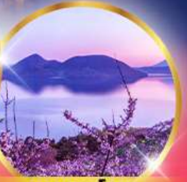
ทะเลสาบโทยะ