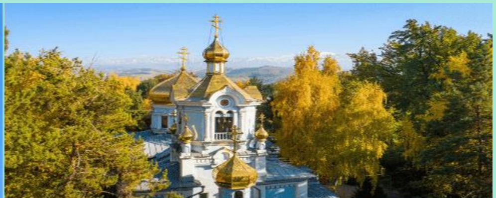
KAZAN ICON OF THE MOTHER OF GOD CATHEDRAL