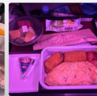
บริการอาหารร้อน ทั้งขาไป และ ขากลับ