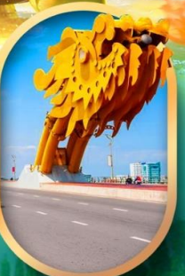
สะพานมังกรคานัง