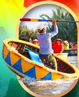
ล่องเรือกระดังง์