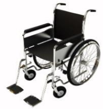
การรับการดูแลเป็นพิเศษ

กรณีผู้เดินทางต้องการความช่วยเหลือเป็นพิเศษ อาทิเช่น การใช้วีลแชร์ กรุณาแจ้งบริษัทฯ อย่างน้อย 7 วันก่อนการเดินทาง มิฉะนั้นบริษัทฯ จะไม่สามารถจัดการล่วงหน้าได้ เนื่องจากการขอใช้วีลแชร์ในสนามบินนั้น ต้องมีขั้นตอนในการขอล่วงหน้า และบางสายการบินอาจมีการเรียกเก็บค่าใช้จ่ายทั้งทางสนามบินในไทยและในต่างประเทศ ซึ่งผู้เดินทางสามารถสอบถามกับเจ้าหน้าที่ได้โดยตรงก่อนทำการจอง และหากในขณะของท่านมีผู้ต้องการดูแลพิเศษ เช่น ผู้ที่นั่งรถเข็น (Wheelchair), เด็ก, ผู้สูงอายุและผู้ที่มีโรคประจำตัวหรือไม่สะดวกในการเดินทางท่องเที่ยวในระยะเวลาเกินกว่า 4-5 ชั่วโมงติดต่อกัน ท่านและครอบครัวต้องให้การดูแลสมาชิกภายในครอบครัวของท่านเอง เนื่องจากการเดินทางเป็นหมู่คณะ หัวหน้าทัวร์มีความจำเป็นต้องดูแลคณะทัวร์ทั้งหมด