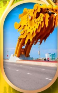
สะพานมังกรดานัง