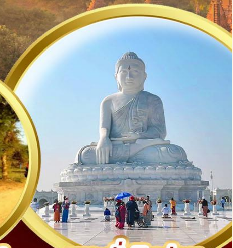
พระนั่งหินอ่อน

พิเศษ..ชมโชว์เชิดหุ่นกระบอก อิ่มอร่อยไปกับ กุ้งแม่น้ำเผาแบบพื้นเมือง