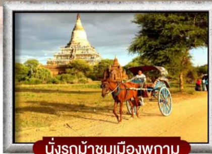
นั่งรถม้าชมเมืองพุกาม