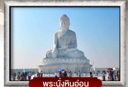
พระนั่งหินอ่อน