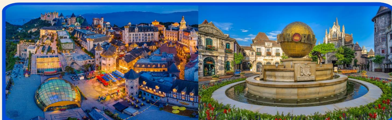
พักผ่อน บานาฮิลล์ 1 คืน