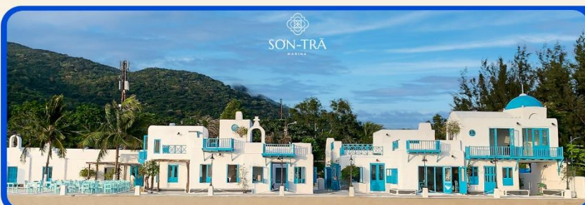
เช็คอินคาเฟ่ SON TRA MARINA