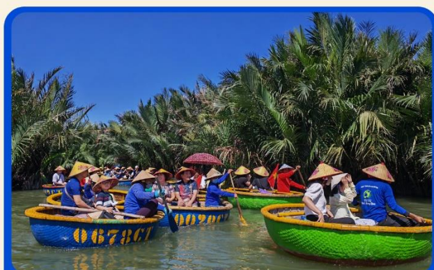
พิเศษ !!! นั่งเรือกระด้ง UNSEEN เวียดนาม