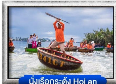
นั่งเรือกระดุง Hoi an