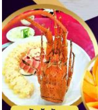
สลัดกุ้งมังกร