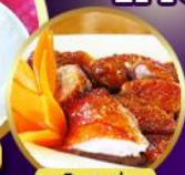
เปิดปีกกึ่ง