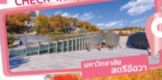
มหาวิทยาลัย สตรีอ็อวา