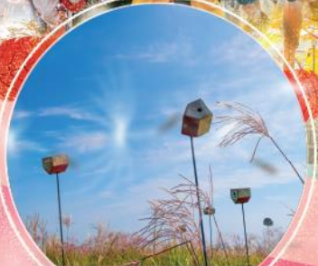
ฮานิลปาร์ค