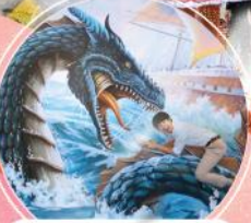
พิพิธภัณฑ์ภาพ 3 มิติ

นำท่านเห็นฟ้าสู่ท่าอากาศยานนานาชาติอินชอน สวนสนุกล็อตเต้เวิลด์...สวนสนุกในร่มที่ใหญ่ที่สุดของประเทศ ฮานิลปาร์ค... มหาวิทยาลัยสตรีอ็อวา โบสถ์เมียงดง พิพิธภัณฑ์ภาพ 3 มิติ พิพิธภัณฑ์น้ำแข็ง โซลทาวเวอร์ หมู่บ้านบุกชอนฮันอก พระราชวังชางด็อกกุง สวมชุดฮันบก... ชุดประจำชาติเกาหลี พร้อมถ่ายรูปเป็นที่ระลึก ช้อปปิ้ง ย่านฮองแด และ เมียงดง เมบูพิชเชซ !!!...บึงย้งบาบิวคิวนูฟเว่ต์ มีน้ำดื่มบริการบนรถบัสส่วนตัว 1 ขวด