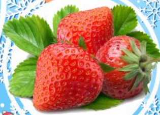
โรสตรอเบอร์รี่