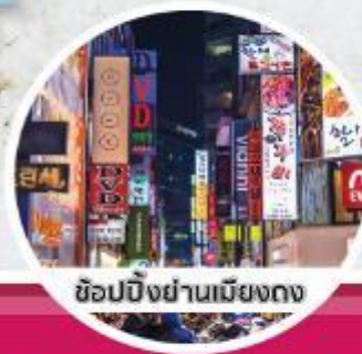
ช้อปปิ้งย่านเมียงดง