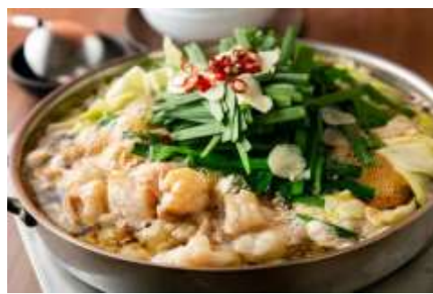
ร้านอาหารย่านยะไต (YATAI)

เย็น อิสระรับประทานอาหารค่ำตามอัธยาศัย เพื่อให้ท่านได้ช้อปปิ้งอย่างเต็มที่ (มีไกด์แนะนำ) พักค้างคืน ณ โรงแรม NISHITETSU GRAND HOTEL (★★★★) หรือเทียบเท่า