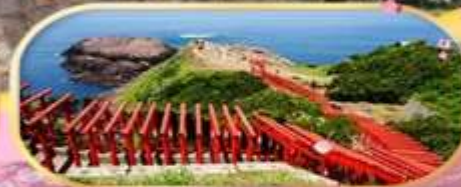
MOTONOSUMI INARI SHRINE

6 วัน 4 คืน พักที่ NISHINO MIYABI แข่งออนไลน์