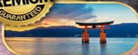
TORI GATE MIYAJIMA