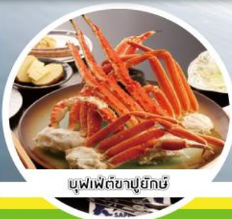
บุฟเฟ่ต์ขาปูยักษ์