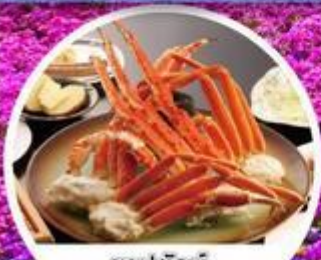
ขาปูยักษ์