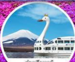
ล่องเรือหงส์