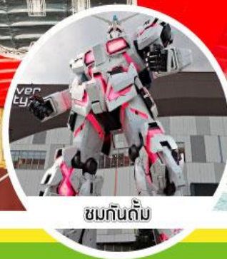
ชมกันดั้ม