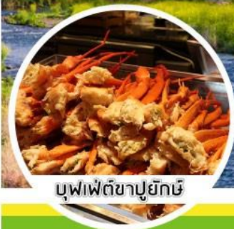
บุฟเฟ่ต์ซาปูยึกิ