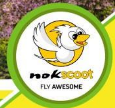
nokscoot FLY AWESOME

ชมดอกซากุระตามฤดูกาล แซ่ซ่าร้อนแซ่ซ่า วัตอาซากุสะ ฝึกฟูจิ