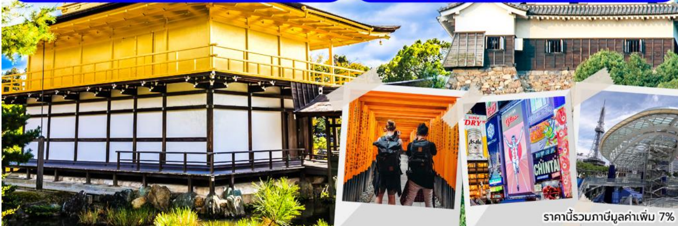
ราคานี้รวมภาษีมูลค่าเพิ่ม 7%