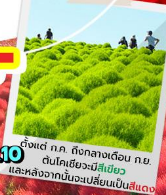
ตั้งแต่ ก.ค. ถึงกลางเดือน ก.ย. ต้นโคเชียจะมีสีเขียว และหลังจากนั้นจะเปลี่ยนเป็นสีแดง

05-09 ก.ค. 62 ติดเสาร์-อาทิตย์ 13-17 ก.ค. 62 วันหยุดอาสาฬหบูชา 25-29 ก.ค. 62 วันหยุดเฉลิมพระชนมพรรษา ร.10 08-12 ส.ค. 62 วันหยุดวันแม่