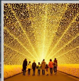
"NABANA NO SATO"