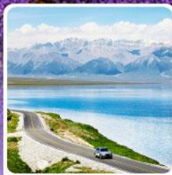
ทะเลสาบไซค์หลี่มู่