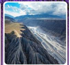
แกรนด์แคนยอนคู่ชานจื่อ