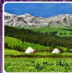
ทุ่งหญ้านาลาตี