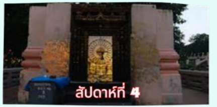
สัปดาห์ที่ 4 รัตนขรเจดีย์ (ซุ้มเรือนแก้ว)

เรียบร้อยแล้ว นำคณะจาริกบุญสวดมนต์ทำวัตรเย็น บูชาพระรัตนตรัย และสวดมนต์บูชาสังเวชนียสถาน จากนั้นเชิญท่านทำศนาธรรม นั่งสมาธิปฏิบัติบูชาตามอธยาศัย สมควรแก่เวลา นัดหมายเวลาเชิญท่านกลับโรงแรมที่พัก