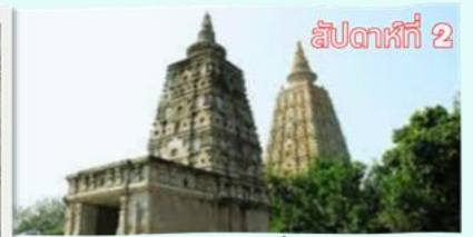
สัปดาห์ที่ 2 อนิมิสเจดีย์