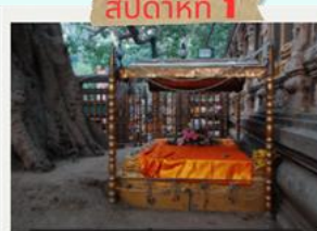
สัปดาห์ที่ 1 พระแท่นวิฆโรอาสน์