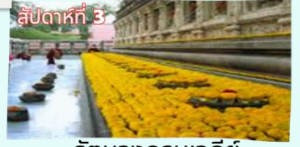
สัปดาห์ที่ 3 รัตนงกรมเจดีย์