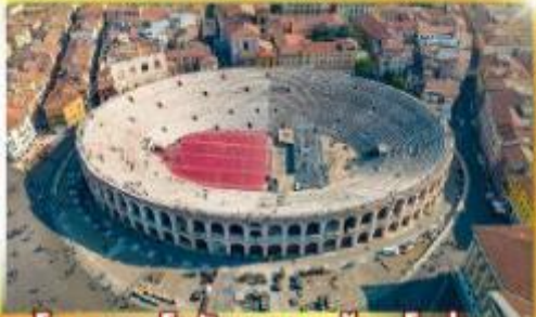
โรงละครโรมันกลางจั๊งเวโรน่า