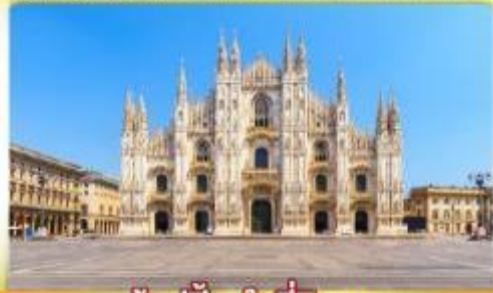
ซ็อบปีงจู่ใจที่มิลาน