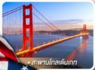
สะพานโกลเดนเกต

★ เยือนอุทยานแกรนด์แคนยอน ฝั่ง South rim ความมหัศจรรย์ทางธรรมชาติ ที่ยิ่งใหญ่ที่สุดแห่งหนึ่งของโลก