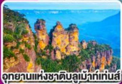
อุทยานแห่งชาติบลูแม้าท์เทนส์