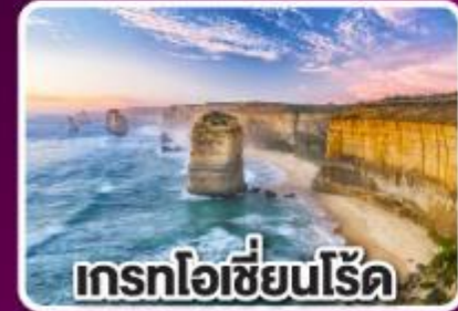
เกรทโอเชียนโรด