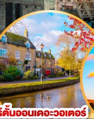
เบอร์ตันออนเดอะวอเตอร์