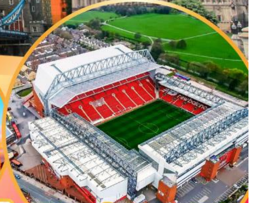
เข้าชมสนามฟุตบอลแอนฟิลด์

เมนูสุดพิเศษ!! Fish & Chips อาหารไทย และ กัดตาการ์ตัง Four Season