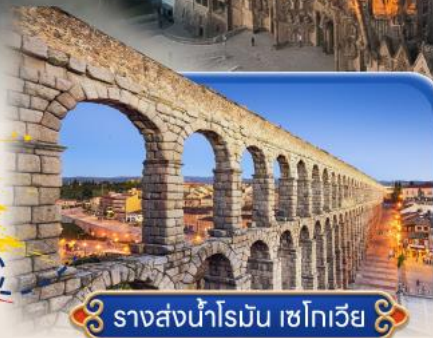
รูปร่างน้ำโรมัน เซโกเวีย