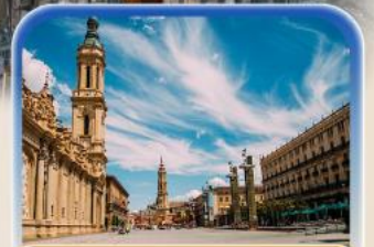
จัตุรัสพลาซ่า เดล ฟัลาร์