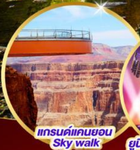
แกรนด์แคนยอน Sky walk