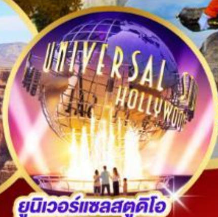
ยูนิเวอร์แซลสตูดิโอ