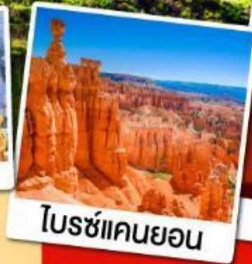
โบซ์แคนยอน