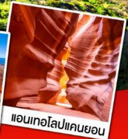
แอนเทอโลปแคนยอน