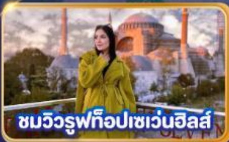
ชมวิวรูปทิวาเซเวนฮิลส์