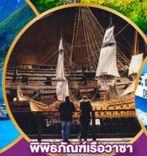
พิพิธภัณฑ์เรืออาซา