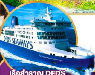
เรือสำราญ DFDS

ทริปพิเศษสุดโรแมนติก ทั้งล่องเรือและรถไฟ หัวใจพองโต